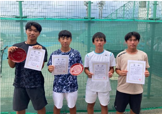
16歳以下男子シングルス