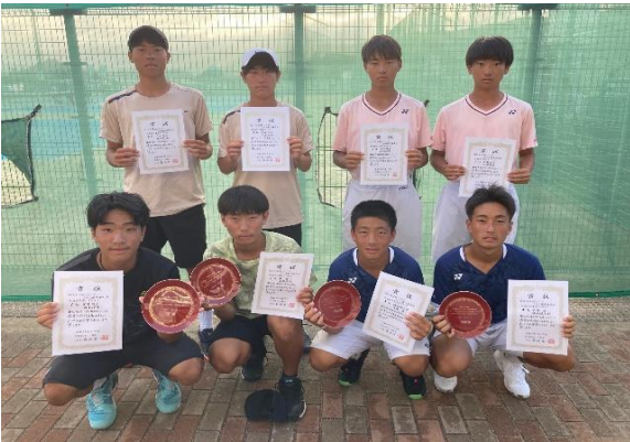
16歳以下男子ダブルス