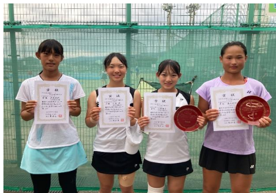
16歳以下女子シングルス