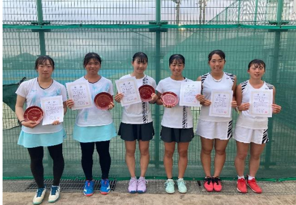
18歳以下女子ダブルス