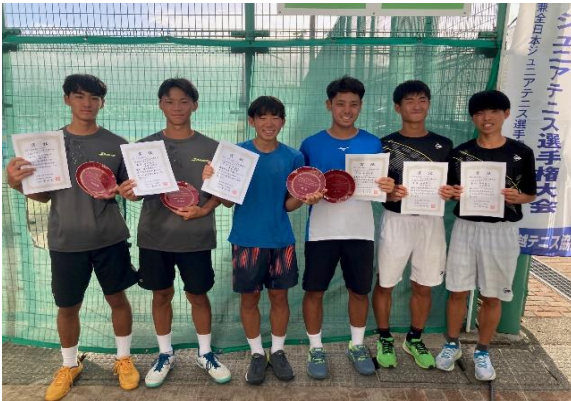
18歳以下男子ダブルス