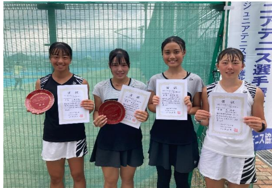
18歳以下女子シングルス